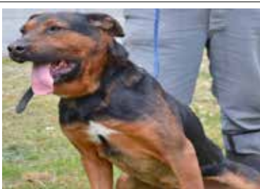
Dżeki - samiec, wiek 9 lat, 60 cm w kłębie.