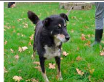
Melon - pies, wiek 9 lat, 25 cm w kłębie