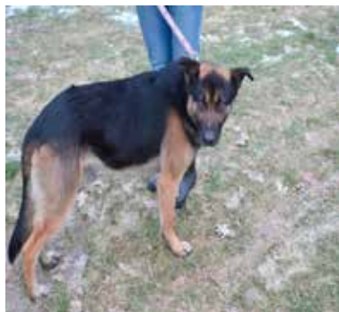
Odi - samiec, wiek - 4 lata, 60 cm w kłębie.