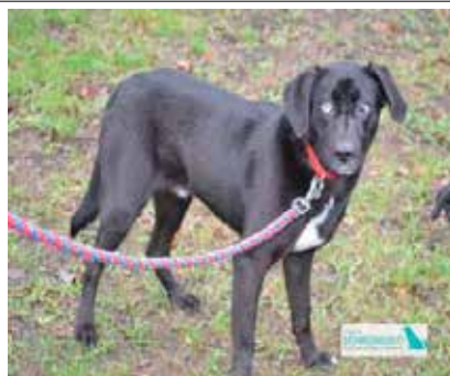
Duet – samiec, wiek 1 rok 43cm w kłębie

Więcej informacji na temat adopcji można uzyskać: