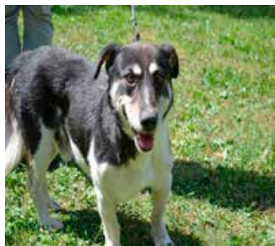
Kumpel - samiec, wiek 7 lat, 40 cm w kłębie.