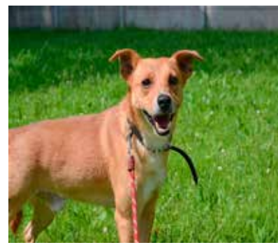
Rydz - samiec, wiek 3 lata, 40 cm w kłębie