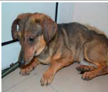
Knypek- samiec, wiek 5 lat, 25 cm w kłębie, bojaźliwy.