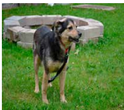
Wicek - samiec, wiek 2 lata, 50 cm w kłębie.