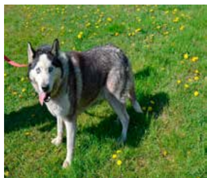
Ziomek - samiec, wiek 9 lat, 55 cm w kłębie.