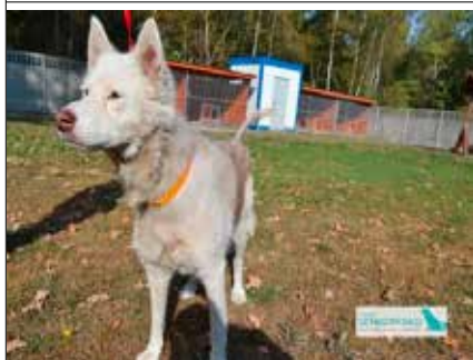
Diana – suczka, wiek 10 lat 53 cm w kłębie