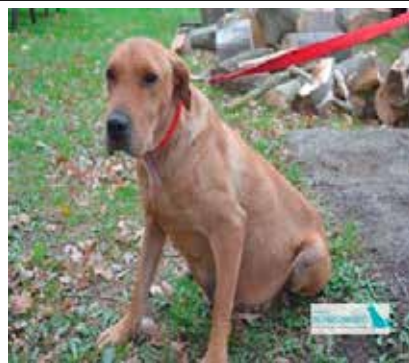
Knieja - samica, wiek 3 lata, 50cm w kłębie.