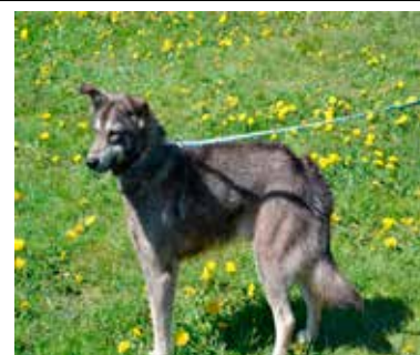
Szarik - samiec, wiek 5 lat, 50 cm w kłębie.