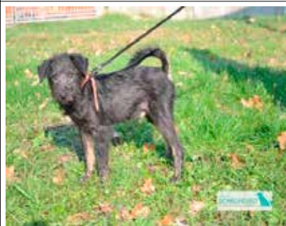
Poldek - pies, 25 cm w kłębie