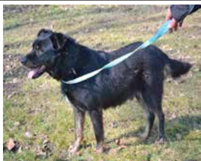
Narcyz - samiec, wiek 9 lat, 55 cm w kłębie.