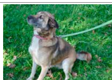
Lu Lu - samica, wiek 9 lat, 60 cm w kłębie.