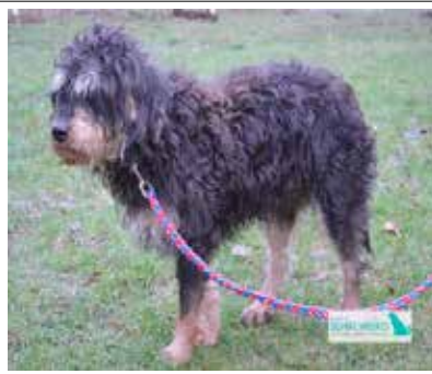
Docent – pies, wiek 1 rok, 40 cm w kłębie