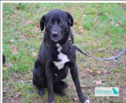
Michałek – pies, wiek 1 rok 43cm w kłębie