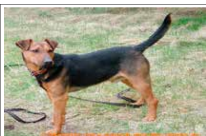
Opel - samiec, wiek 9 lat, 45 cm w kłębie.