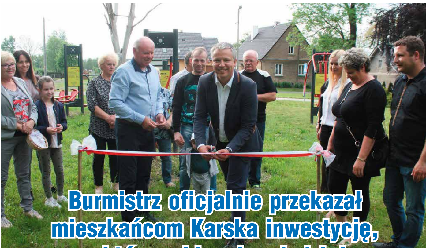
Burmistrz oficjalnie przekazał mieszkańcom Karska inwestycję, o którą zabiegała młodzież