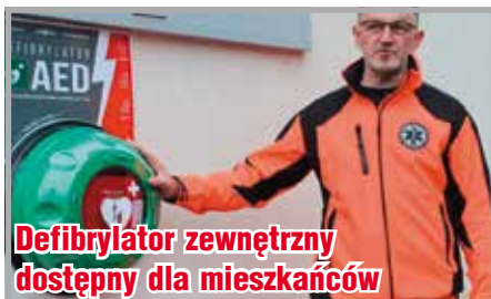
Defibrylator zewnętrzny dostępny dla mieszkańców