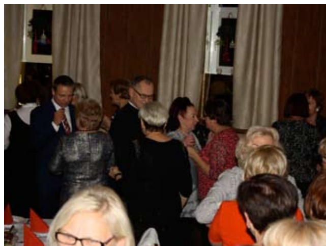
Uniwersytet Trzeciego Wieku